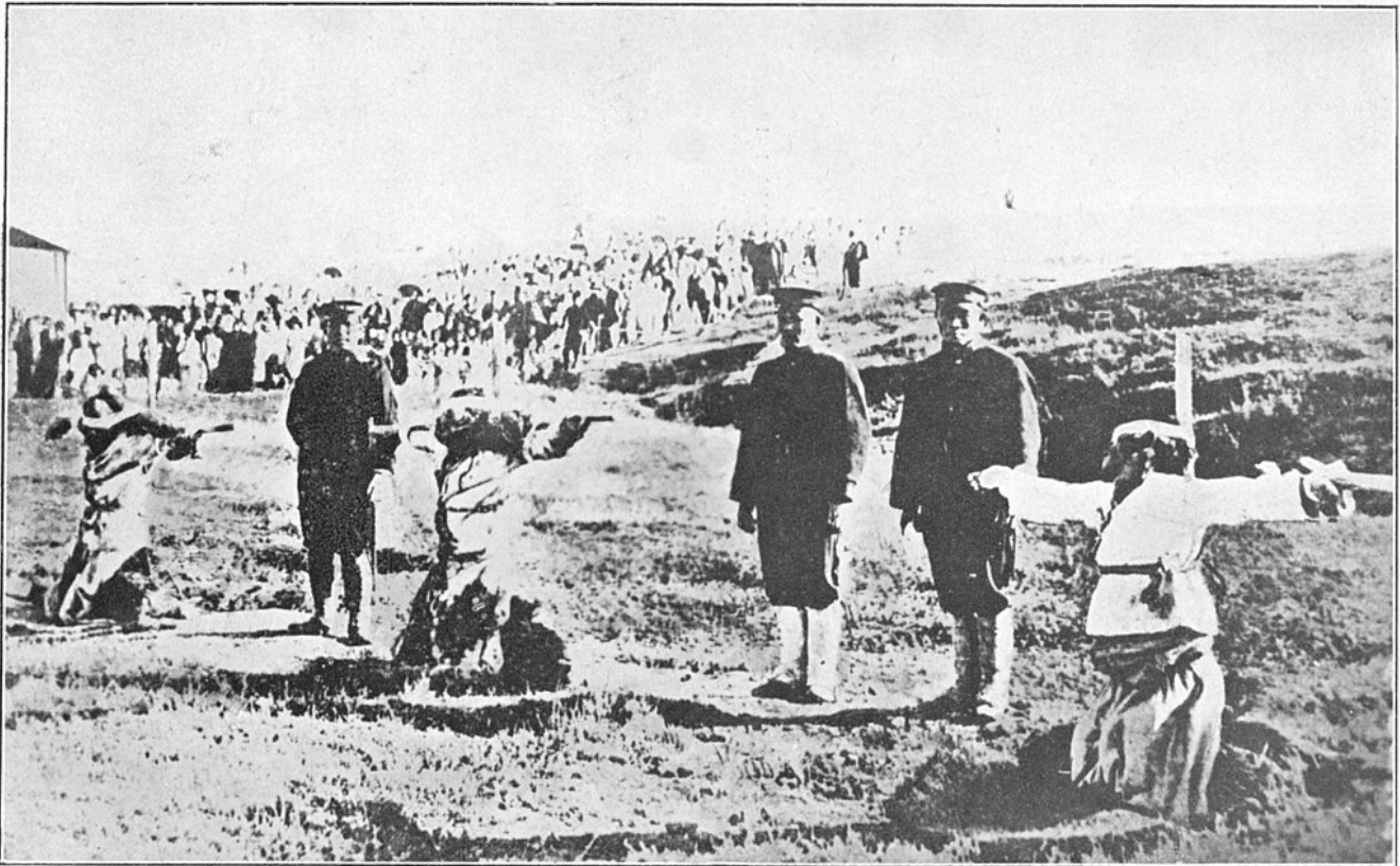
Les Japonais crucifient les Coréens chrétiens « coupables » de vouloir la libération de leur pays du joug japonais (1919).

Dans une société où certains secteurs se réjouissent de la colonisation nippone, car ils y voient une opportunité de modernisation, les protestants prennent une part très active au mouvement de résistance et à la déclaration d'indépendance du 1er mars 1919. L'Église catholique cherche plutôt la conciliation. En s'identifiant avec l'aspiration nationale à regagner une totale souveraineté, les Églises protestantes acquièrent une indéniable crédibilité au sein d'une population traumatisée par la brutalité des autorités japonaises.