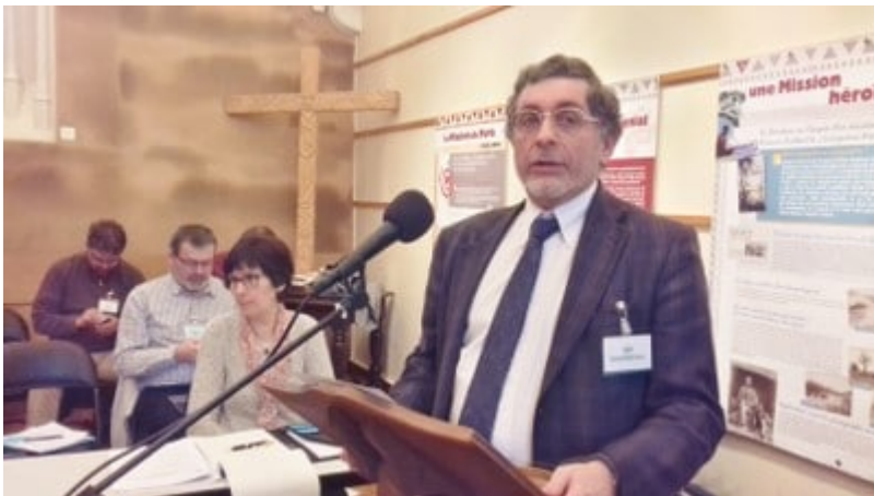
Message du président du Défap

Voici trois exemples parmi beaucoup d'autres qui témoignent clairement que la place des religions est aujourd'hui en crise.