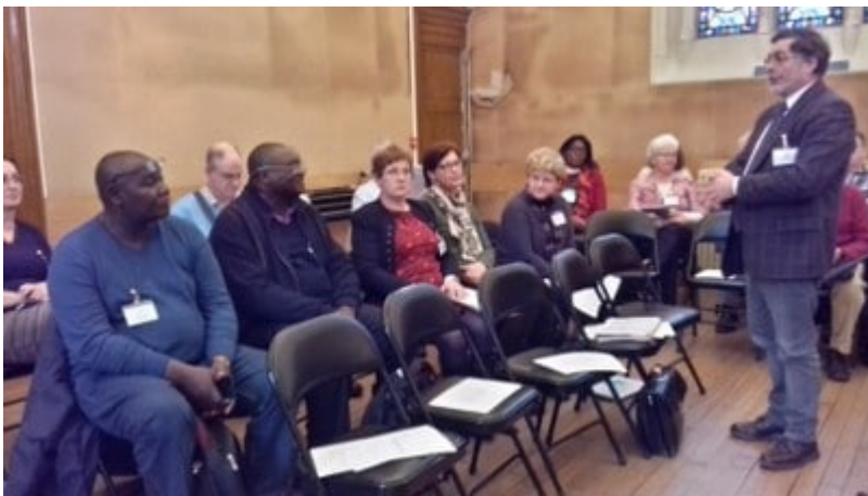
Le président du Défap présentant les délégués de l'EELRCA