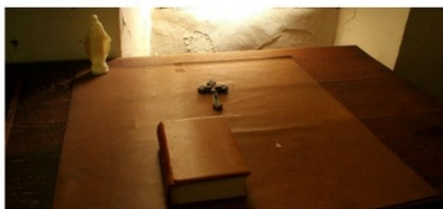
En 2016, RCF a choisi le thème de la sobriété pour accompagner ses auditeurs tout au long du carême

[Carême] La sobriété, nouveau nom du jeûne ? 🐦 📺 📷 🗨️