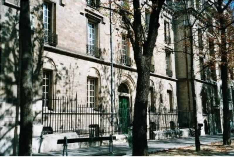
Le 102 boulevard Arago, à Paris, siège du Défap

Mais cette présentation du projet de «mini-forums» a aussi permis de souligner la raréfaction des correspondants locaux, chargés de porter les enjeux de la Mission au coeur de leur paroisse. Une raréfaction qui pourrait être compensée en regroupant les forces au niveau régional sous forme «d'équipes Mission» ; mais quelle en est l'origine ? La discussion lancée sur ce propos a pointé rapidement l'existence de «classes creuses» dans la mission : plus précisément, après la fin du service militaire. Du coup, la Mission manque aujourd'hui d'anciens envoyés pour aller plaider sa cause au sein des paroisses. Une solution envisagée : encourager les projets de voyage, pour que celles et ceux qui vivent cette expérience de la rencontre aient envie de lui donner des suites et deviennent naturellement des avocats de la Mission. Le projet de «mini-forums» pourrait y aider.