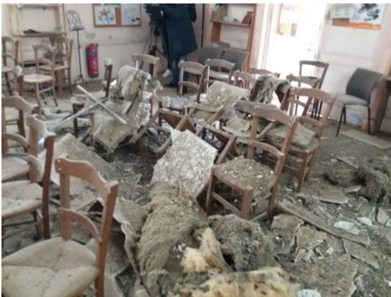
Les dégâts subis par le temple de Mont-de-Marsan

Lors de la journée organisée pour l'accueillir en octobre 2017, étaient ainsi invités l'administrateur apostolique du diocèse d'Aire et Dax, les curés de Dax et de Mont-de-Marsan, le pasteur de l'Église méthodiste... Fabrice Benoît songe à présent à relancer une association réunissant toutes les confessions chrétiennes de la ville, «Bible et Culture», quelque peu tombée en sommeil ces dernières années.