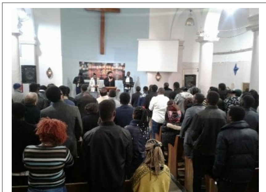
Un culte dominical à l'Église Réformée de Tunisie

Kallaline), a dû s'impliquer dans l'accompagnement des étudiants subsahariens et l'accompagnement des migrants.