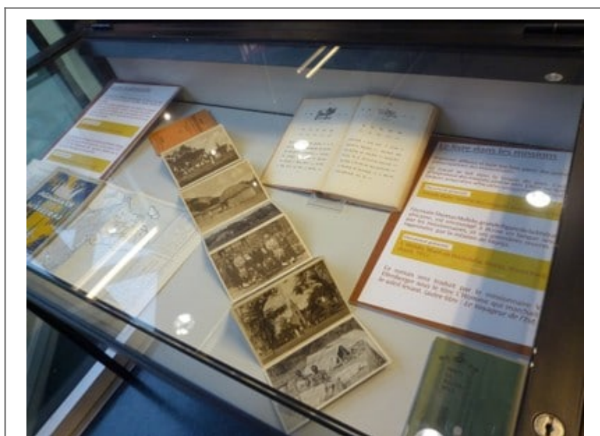
Vue de l'exposition à la BU de La Rochelle

À l'occasion des 500 ans de la Réforme, la Bibliothèque universitaire de La Rochelle a décidé d'accompagner les festivités organisées dans la ville à travers plusieurs expositions sur le protestantisme. L'une d'entre elles, notamment, consacrée aux missionnaires protestants, a été organisée avec l'aide de la bibliothèque du Défap, qui a fourni divers livres, documents et objets venant des collections du Service protestant de Mission. Retour en images.