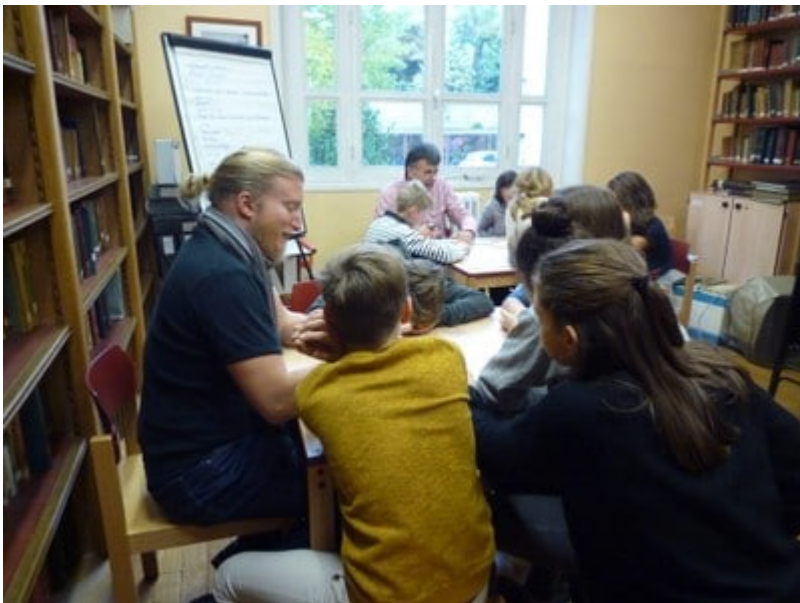
Le groupe de jeunes catéchumènes lyonnais en visite à la bibliothèque du Défap