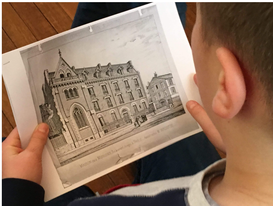
Un des jeunes alsaciens feuillette les illustrations du bâtiment du Défap, 2017