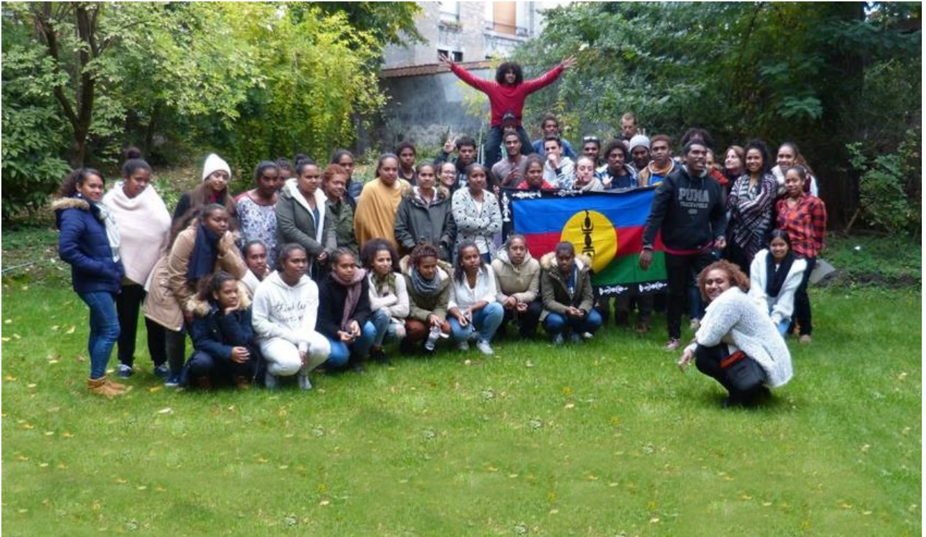
photo de groupe, octobre 2016